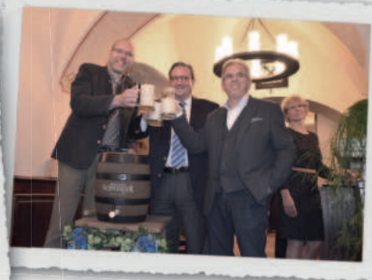
Neueröffnung am 14. April 2015