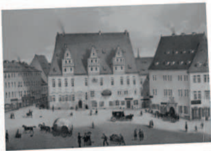
Alte Aufnahme vom Ratskeller

Die Betreiber des Ratskellers wirkten zu jener Zeit nicht nur als Pächter der Stadt Meißen, sondern beeinflussten mit dieser Gaststätte auch die Versorgung, die Kommunikation und die sozialen Strukturen der Stadt Meißen.