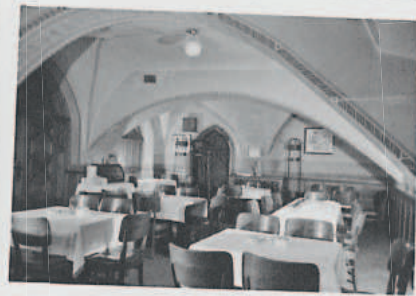
Innenaufnahme um 1970