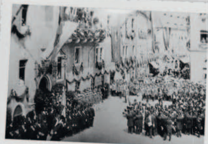
Königlicher Besuch am 3. Juli 1903

Am Ostermontag, dem 14. April, wird durch Familie Müller, Inhaber von Müller Restaurants, der Ratskeller wiedereröffnet. Vorausgegangen waren monatelange Umbaumaßnahmen, Renovierungen und eine aufwendige, komplette Neugestaltung der Innenräume.