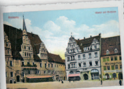
Markt mit Rathaus in Meißen, um 1900