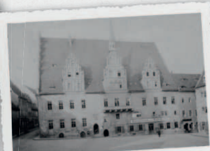
Alte Aufnahme um 1970